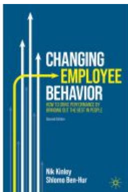
Changing Employee Behavior Ladenpreis: 38,49EUR

Wir haben andere Produkte gefunden, die Ihnen gefallen könnten!