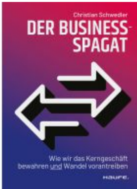
Der Business-Spagat Ladenpreis: 41,20EUR