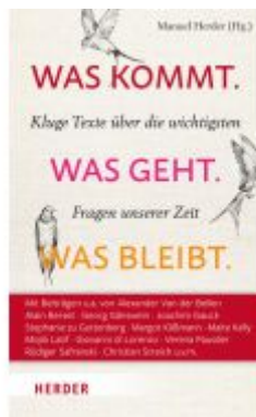
Was kommt. Was geht. Was bleibt. Ladenpreis: 36,00EUR