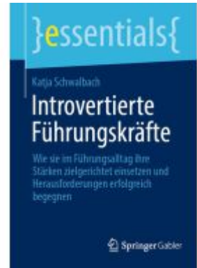
Introvertierte Führungskräfte Ladenpreis: 15,41EUR