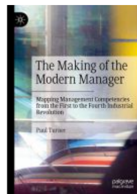
The Making of the Modern Manager Ladenpreis: 175,99EUR