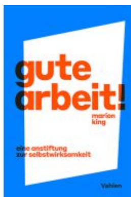
Gute Arbeit! Ladenpreis: 30,70EUR