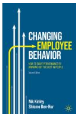
Changing Employee Behavior Ladenpreis: 38,49EUR