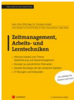
Zeitmanagement, Arbeits- und Lerntechniken Ladenpreis: 28,00 EUR

Wir haben andere Produkte gefunden, die Ihnen gefallen könnten!