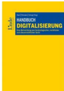
Handbuch Digitalisierung Ladenpreis: 129,00 EUR