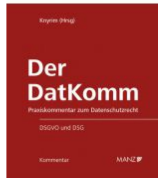
Der DatKomm Ladenpreis: 224,00 EUR