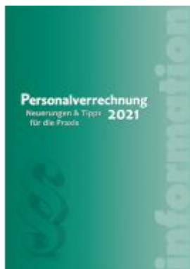
Personalverrechnung 2021 Ladenpreis: 39,90 EUR