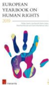
European Yearbook on Human Rights 2019 Ladenpreis: 89,00 EUR