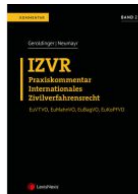
IZVR Praxiskommentar Internationales Zivilverfahrensrecht Aktionspreis: 111,20 EUR Ladenpreis: 139,00 EUR