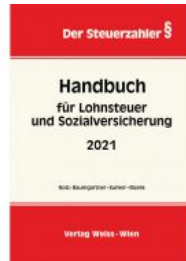
Handbuch für Lohnsteuer und Sozialversicherung 2021 Ladenpreis: 61,60 EUR