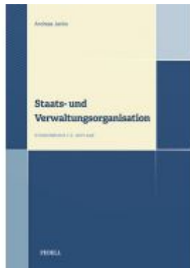
Staats- und Verwaltungsorganisation Ladenpreis: 30,00 EUR