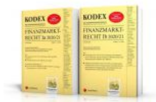
KODEX Finanzmarktrecht Band Ia + Ib 2020/21 Ladenpreis: 95,00 EUR