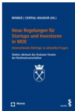
Neue Regelungen für Startups und Investoren in MOE Ladenpreis: 38,00 EUR