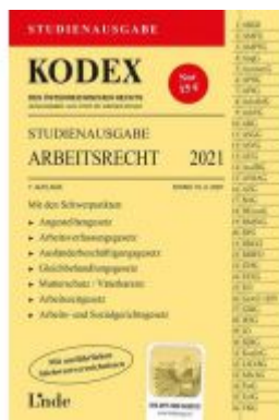
KODEX Studienausgabe Arbeitsrecht 2021 Ladenpreis: 15,00 EUR