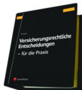
Versicherungsrechtliche Entscheidungen - aufbereitet für die Praxis Ladenpreis: 329,00 EUR