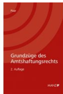
Grundzüge des Amtshaftungsrechts Ladenpreis: 36,00 EUR