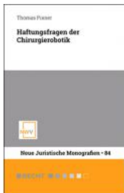
Haftungsfragen der Chirurgierobotik Ladenpreis: 54,00 EUR