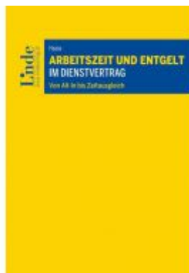
Arbeitszeit und Entgelt im Dienstvertrag Ladenpreis: 32,00 EUR