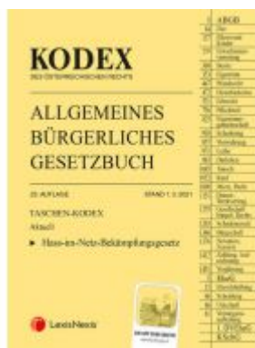
Taschen-Kodex ABGB 2021 Ladenpreis: 19,00 EUR