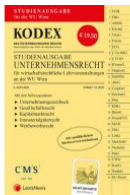
KODEX Unternehmensrecht für wirtschaftsrechtliche LVA 2020/21 Ladenpreis: 19,50 EUR