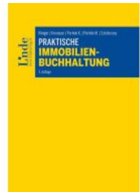
Praktische Immobilienbuchhaltung Ladenpreis: 72,00EUR