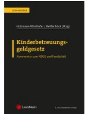
Kinderbetreuungsgeldgesetz Ladenpreis: 82,00EUR