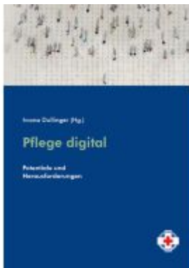
Pflege digital Ladenpreis: 16,90EUR