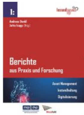
Berichte aus Praxis und Forschung - Asset Management. Instandhaltung. Digitalisierung. Ladenpreis: 79,90EUR