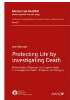
Protecting Life by Investigating Death Ladenpreis: 84,00EUR