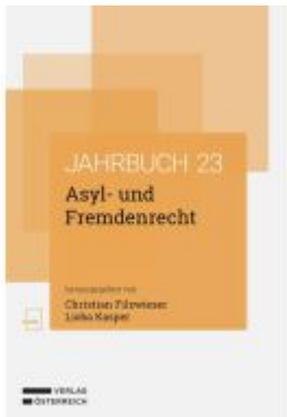
Asyl- und Fremdenrecht Ladenpreis: 88,00EUR