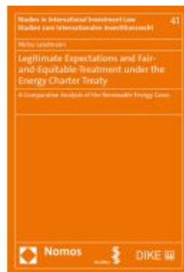
Legitimate Expectations and Fair-and-Equitable-Treatment under the Energy Charter Treaty Ladenpreis: 100,80EUR