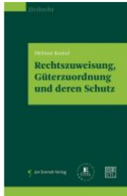
Rechtszuweisung, Güterzuordnung und deren Schutz Ladenpreis: 78,00EUR