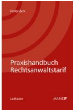
Praxishandbuch Rechtsanwaltstarif Ladenpreis: 44,00EUR