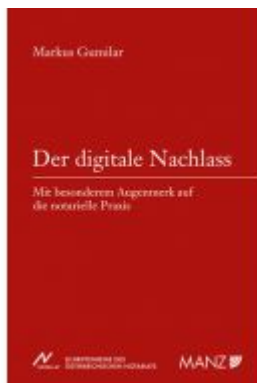
Der digitale Nachlass Ladenpreis: 54,00EUR