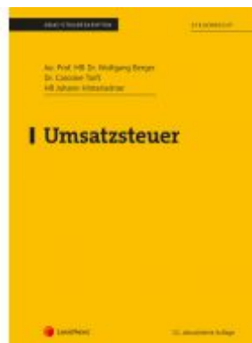
Umsatzsteuer (Skriptum) Ladenpreis: 35,00EUR