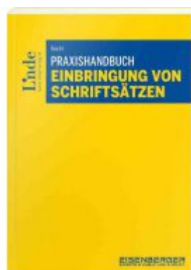
Praxishandbuch Einbringung von Schriftsätzen Ladenpreis: 79,00EUR