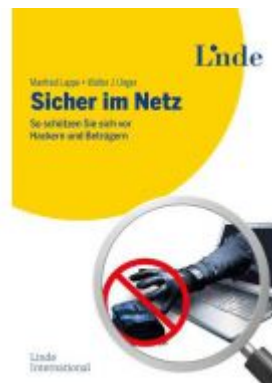
Sicher im Netz Ladenpreis: 24,90EUR