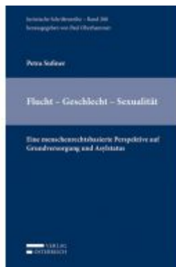
Flucht - Geschlecht - Sexualität Ladenpreis: 98,00EUR