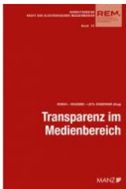
Transparenz im Medienbereich Aktuelle Fragen der Umsetzung Ladenpreis: 42,00EUR