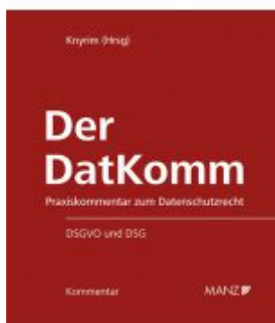
Der DatKomm Ladenpreis: 248,00EUR