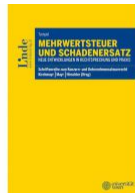
Mehrwertsteuer und Schadenersatz Ladenpreis: 58,00EUR