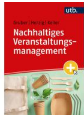
Nachhaltiges Veranstaltungsmanagement Ladenpreis: 28,70EUR