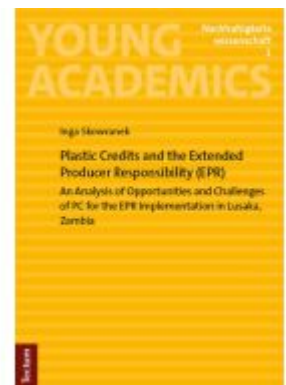
Plastic Credits and the Extended Producer Responsibility (EPR) Ladenpreis: 40,10EUR