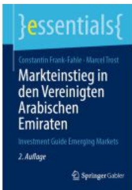
Markteinstieg in den Vereinigten Arabischen Emiraten Ladenpreis: 15,41EUR