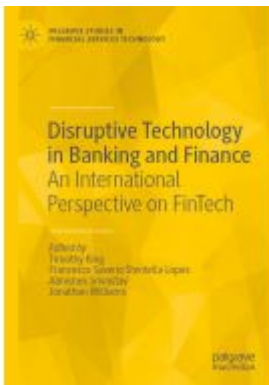
Disruptive Technology in Banking and Finance Ladenpreis: 164,99EUR