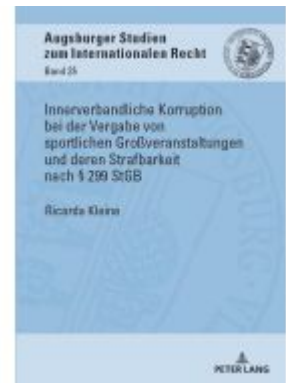
Innerverbandliche Korruption bei der Vergabe von sportlichen Großveranstaltungen und deren Strafbarkeit nach § 299 StGB Ladenpreis: 56,50EUR