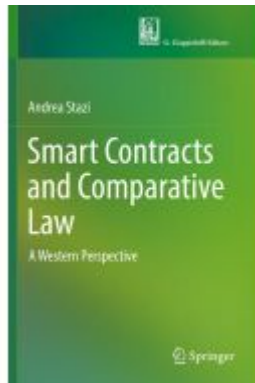
Smart Contracts and Comparative Law Ladenpreis: 142,99EUR