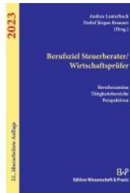
Berufsziel Steuerberater-Wirtschaftsprüfer 2023. Ladenpreis: 25,60EUR