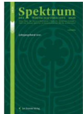
Spektrum des Wirtschaftsrechts Ladenpreis: 85,00 EUR