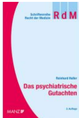
Das psychiatrische Gutachten Ladenpreis: 78,00 EUR