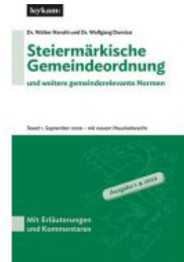
Steiermärkische Gemeindeordnung und weitere gemeinderelevante Normen Ladenpreis: 75,00 EUR