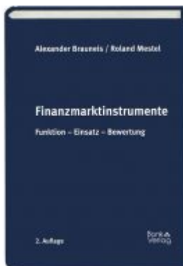
Finanzmarktinstrumente Ladenpreis: 35,00 EUR