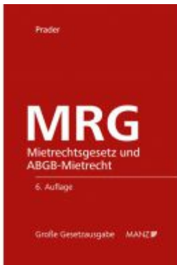
MRG - Mietrechtsgesetz und ABGB- Mietrecht Ladenpreis: 194,00 EUR