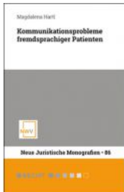
Kommunikationsprobleme fremdsprachiger Patienten Ladenpreis: 58,00 EUR