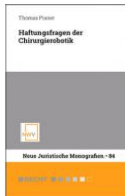
Haftungsfragen der Chirurgierobotik Ladenpreis: 54,00 EUR