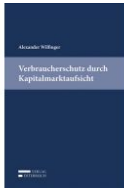
Verbraucherschutz durch Kapitalmarktaufsicht Ladenpreis: 59,00 EUR