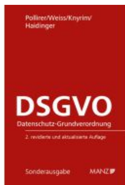
DSGVO Datenschutz-Grundverordnung Ladenpreis: 34,00EUR