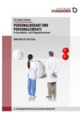
Personalbedarf und Personaleinsatz in Gesundheits- und Pflegeunternehmen Ladenpreis: 64,90EUR