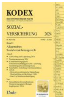
KODEX Sozialversicherung 2024, Band I Ladenpreis: 46,00EUR