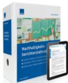
Praxishandbuch Nachhaltigkeits- Berichterstattung Ladenpreis: 272,80EUR