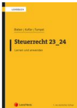
Steuerrecht 23_24 Ladenpreis: 70,00EUR