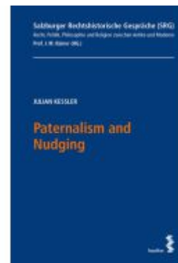
Paternalism and Nudging Ladenpreis: 22,00EUR