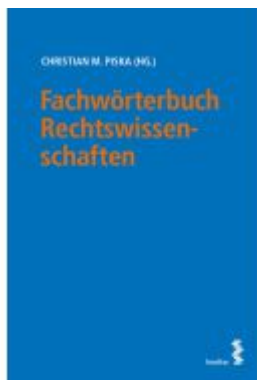
Fachwörterbuch Rechtswissenschaften Ladenpreis: 30,00EUR

Wir haben andere Produkte gefunden, die Ihnen gefallen könnten!