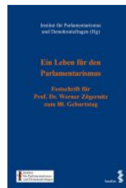
Ein Leben für den Parlamentarismus Ladenpreis: 160,00EUR