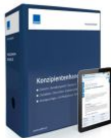
Konzipientenhandbuch Ladenpreis: 239,80EUR