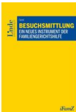
Besuchsmittlung Ladenpreis: 48,00EUR