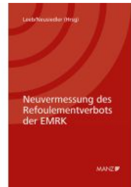
Neuvermessung des Refoulementverbots der EMRK Ladenpreis: 39,00EUR