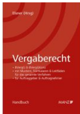
Vergaberecht Ladenpreis: 128,00EUR