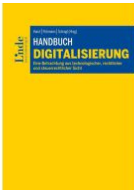
Handbuch Digitalisierung Ladenpreis: 129,00EUR

Wir haben andere Produkte gefunden, die Ihnen gefallen könnten!