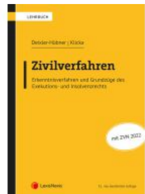
Zivilverfahren Ladenpreis: 69,00EUR