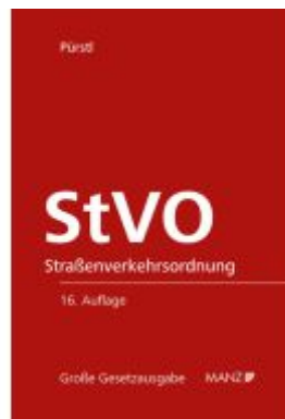
Straßenverkehrsordnung StVO Ladenpreis: 238,00EUR