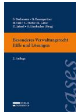
Besonderes Verwaltungsrecht - Fälle und Lösungen Ladenpreis: 33,00EUR