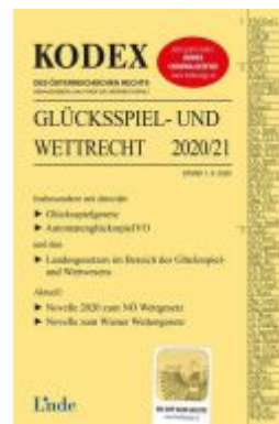
KODEX Glücksspiel- und Wettrecht 2020/21 Ladenpreis: 68,00 EUR