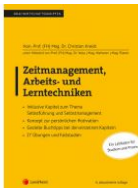
Zeitmanagement, Arbeits- und Lerntechniken Ladenpreis: 28,00 EUR