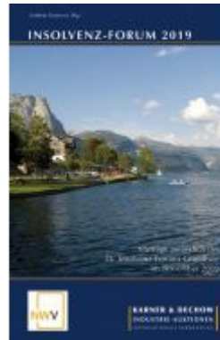
Insolvenz-Forum 2019 Ladenpreis: 54,80 EUR