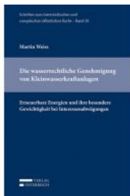
Die wasserrechtliche Genehmigung von Kleinwasserkraftanlagen Ladenpreis: 54,00 EUR