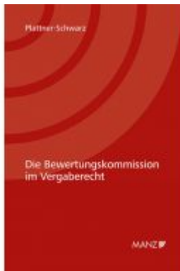
Die Bewertungskommission im Vergaberecht Ladenpreis: 118,00 EUR