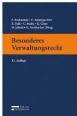
Besonderes Verwaltungsrecht Ladenpreis: 55,00 EUR