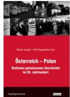
Österreich-Polen Ladenpreis: 30,00 EUR