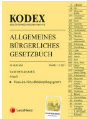
Taschen-Kodex ABGB 2021 Ladenpreis: 19,00 EUR

Wir haben andere Produkte gefunden, die Ihnen gefallen könnten!