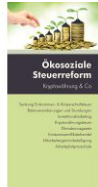
Ökosoziale Steuerreform Ladenpreis: 12,60EUR