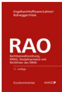
Rechtsanwaltsordnung RAO Ladenpreis: 210,00EUR

Wir haben andere Produkte gefunden, die Ihnen gefallen könnten!