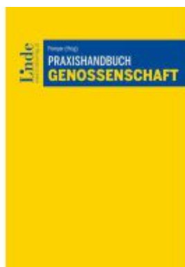
Praxishandbuch Genossenschaft Ladenpreis: 78,00EUR