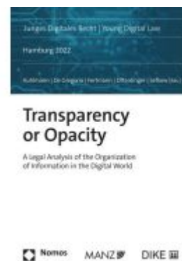
Transparency or Opacity A Legal Analysis of the Organization of Information in the Digital World Ladenpreis: 74,00EUR