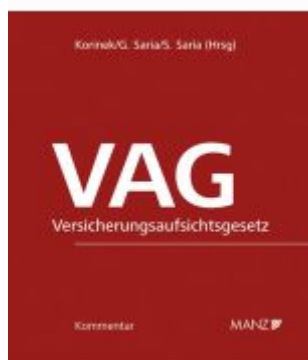
VAG - Versicherungsaufsichtsgesetz Ladenpreis: 348,00EUR