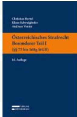
Österreichisches Strafrecht. Besonderer Teil I (§§ 75 bis 168g StGB) Ladenpreis: 39,00EUR