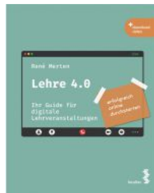
Lehre 4.0 Ladenpreis: 21,90EUR