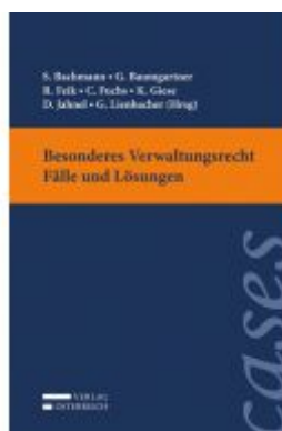
Besonderes Verwaltungsrecht - Fälle und Lösungen Ladenpreis: 33,00 EUR