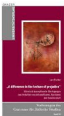
A difference in the texture of prejudice Ladenpreis: 12,90 EUR