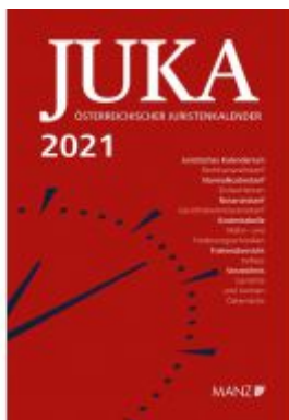
Österreichischer Juristenkalender 2021 JuKa Ladenpreis: 129,00 EUR