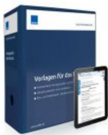
Vorlagen für das Notariat Ladenpreis: 233,26 EUR