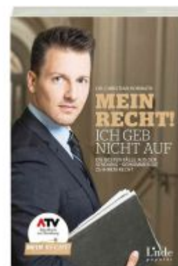
Mein Recht - Ich geb nicht auf Ladenpreis: 19,90 EUR