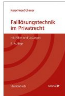
Falllösungstechnik im Privatrecht Mit Fällen und Lösungen Ladenpreis: 39,00 EUR