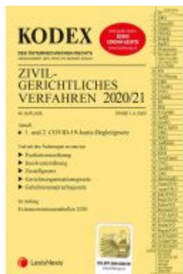
KODEX Zivilgerichtliches Verfahren 2020/21 Ladenpreis: 40,00 EUR