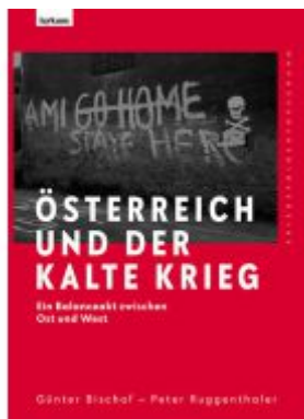
Österreich und der Kalte Krieg Ladenpreis: 39,00EUR