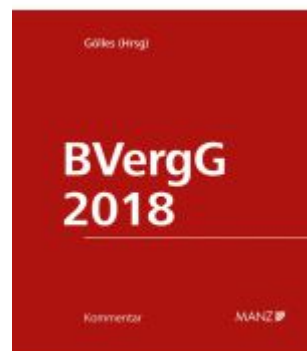
BVerGG 2018 Ladenpreis: 298,00EUR