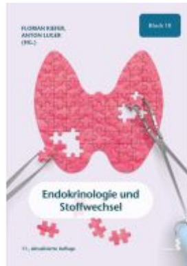
Endokrinologie und Stoffwechsel Ladenpreis: 25,90EUR