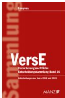
Versicherungsrechtliche Entscheidungssammlung VersE Ladenpreis: 259,00EUR

Wir haben andere Produkte gefunden, die Ihnen gefallen könnten!