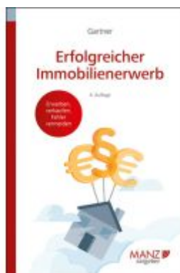
Erfolgreicher Immobilienerwerb Ladenpreis: 23,80EUR