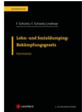
Lohn- und Sozialdumping-Bekämpfungsgesetz LSD-BG Ladenpreis: 148,00EUR