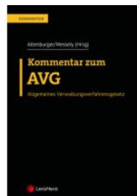
Kommentar zum AVG Ladenpreis: 218,00EUR