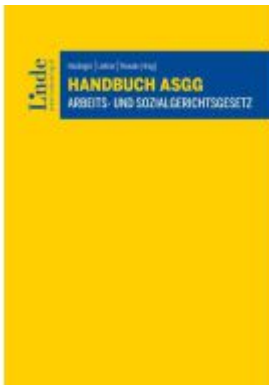
Handbuch ASGG | Arbeits- und Sozialgerichtsgesetz Ladenpreis: 59,00EUR