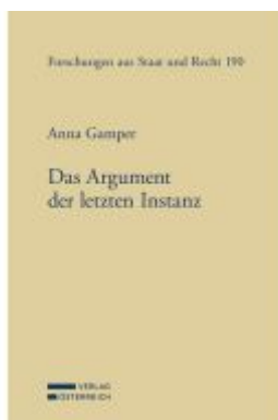
Das Argument der letzten Instanz Ladenpreis: 110,00EUR