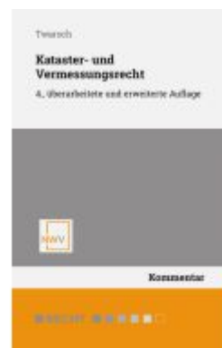
Kataster- und Vermessungsrecht Ladenpreis: 58,00EUR