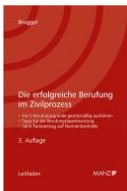
Die erfolgreiche Berufung im Zivilprozess