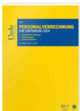
Personalverrechnung: eine Einführung 2024