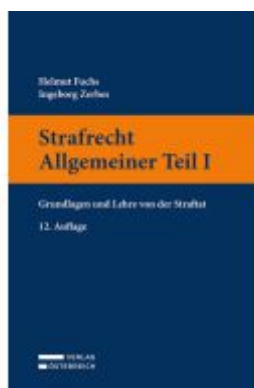
Strafrecht Allgemeiner Teil I