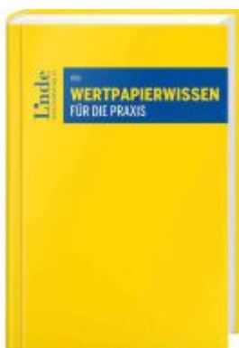
Wertpapierwissen für die Praxis Ladenpreis: 129,00EUR