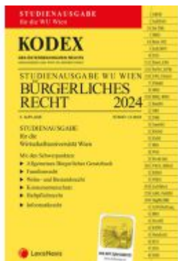
KODEX Bürgerliches Recht für die WU 2024 - inkl. App Ladenpreis: 21,00EUR

Wir haben andere Produkte gefunden, die Ihnen gefallen könnten!