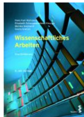
Wissenschaftliches Arbeiten Ladenpreis: 22,00EUR