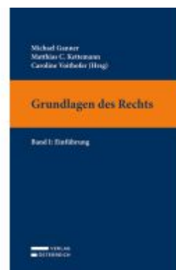
Grundlagen des Rechts