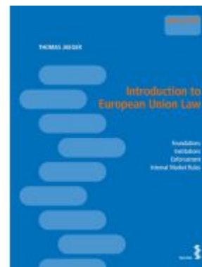
Introduction to European Union Law Ladenpreis: 24,00EUR