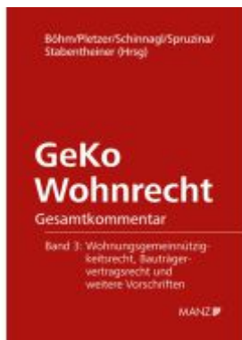
GeKo Wohnrecht Gesamtkommentar Band 3 Ladenpreis: 228,00EUR