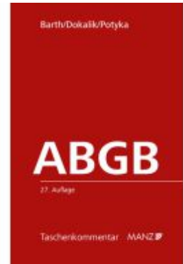
Das Allgemeine bürgerliche Gesetzbuch ABGB Ladenpreis: 134,00EUR