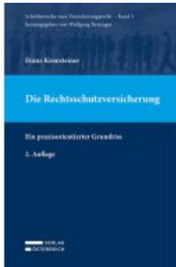
Die Rechtsschutzversicherung Ladenpreis: 69,00EUR