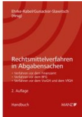
Rechtsmittelverfahren in Abgabensachen Ladenpreis: 89,00EUR