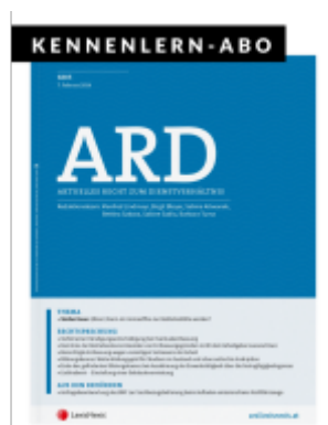
ARD Zeitschrift - Kennenlern-Abo (4 Hefte) Ladenpreis: 50,00EUR