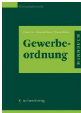
Handbuch zur Gewerbeordnung Ladenpreis: 65,00EUR

Wir haben andere Produkte gefunden, die Ihnen gefallen könnten!