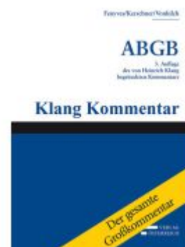
Großkommentar zum ABGB - Klang Kommentar Ladenpreis: 5.729,85EUR