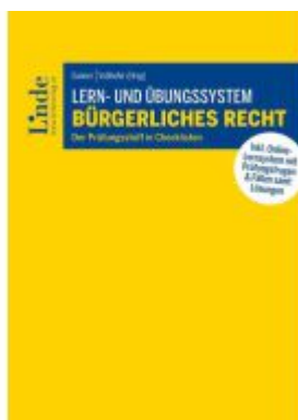
Lern- und Übungssystem Bürgerliches Recht Ladenpreis: 50,00EUR