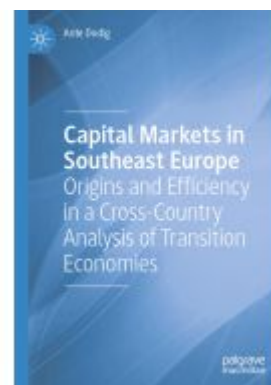
Capital Markets in Southeast Europe Ladenpreis: 109,99EUR