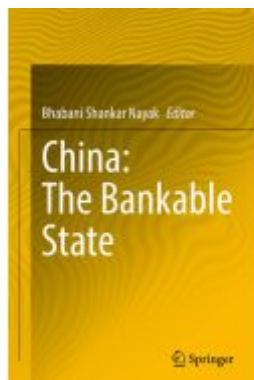
China: The Bankable State Ladenpreis: 164,99EUR