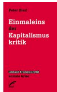
Einmaleins der Kapitalismuskritik Ladenpreis: 10,10EUR