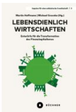
Lebensdienlich wirtschaften Ladenpreis: 27,00EUR