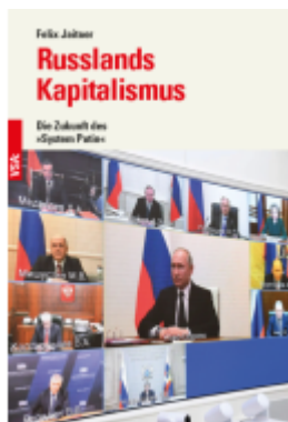
Russlands Kapitalismus Ladenpreis: 17,30EUR

Wir haben andere Produkte gefunden, die Ihnen gefallen könnten!