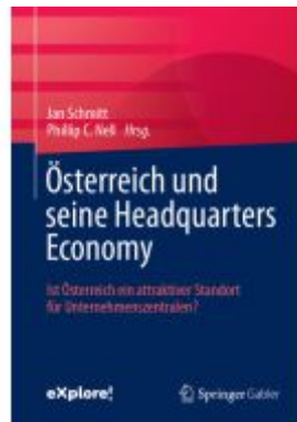
Österreich und seine Headquarters Economy