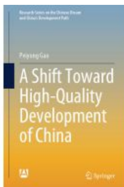
A Shift Toward High-Quality Development of China Ladenpreis: 131,99EUR