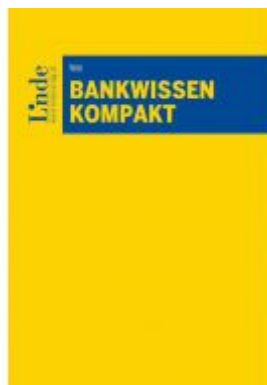
Bankwissen kompakt Ladenpreis: 58,00 EUR