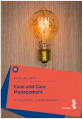
Case und Care Management Ladenpreis: 24,90EUR