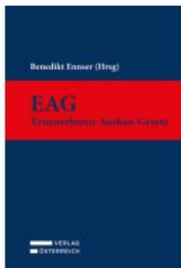
EAG - Erneuerbaren-Ausbau-Gesetz Ladenpreis: 89,00EUR