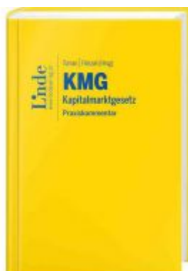
KMG | Kapitalmarktgesetz Ladenpreis: 89,00 EUR