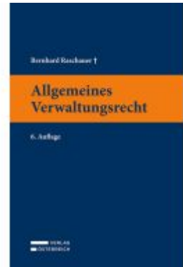
Allgemeines Verwaltungsrecht Ladenpreis: 49,00EUR