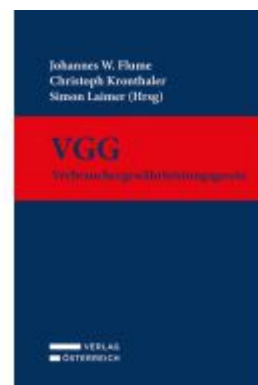
VGG - Verbrauchergewährleistungsgesetz Ladenpreis: 139,00EUR