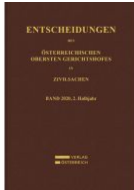
Entscheidungen des Obersten Gerichtshofes in Zivilsachen Ladenpreis: 208,00EUR