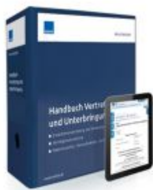
Handbuch Vertretung und Unterbringung Ladenpreis: 228,90 EUR