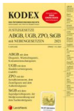
KODEX Justizgesetze 2021 Ladenpreis: 29,00 EUR