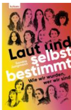
Laut und selbstbestimmt Ladenpreis: 22,00EUR