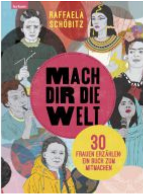
Mach dir die Welt Ladenpreis: 25,50EUR