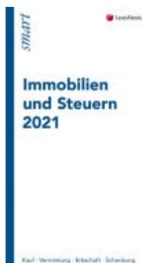
Immobilien und Steuern 2021 Ladenpreis: 12,00 EUR