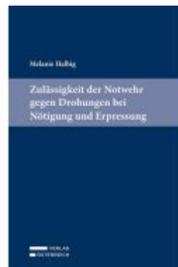
Zulässigkeit der Notwehr gegen Drohungen bei Nötigung und Erpressung Ladenpreis: 89,00EUR