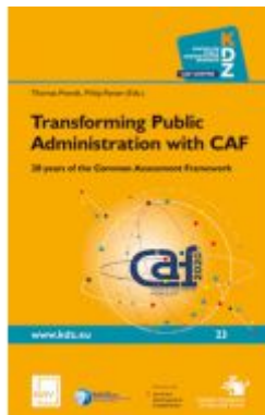
Transforming Public Administration with CAF Ladenpreis: 46,80 EUR