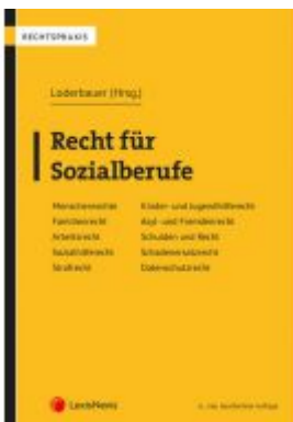
Recht für Sozialberufe Ladenpreis: 62,00 EUR