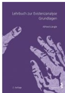
Lehrbuch zur Existenzanalyse Ladenpreis: 19,90 EUR