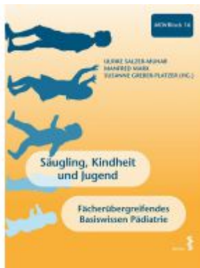
Säugling, Kindheit und Jugend Ladenpreis: 34,90 EUR