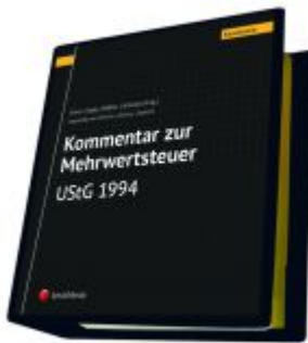
Kommentar zur Mehrwertsteuer - UStG 1994 Ladenpreis: 681,00 EUR

Wir haben andere Produkte gefunden, die Ihnen gefallen könnten!