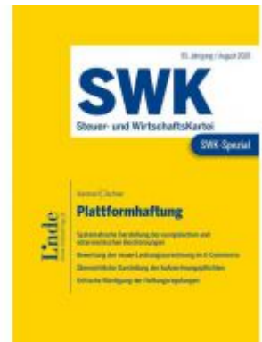
SWK-Spezial Plattformhaftung Ladenpreis: 26,00 EUR