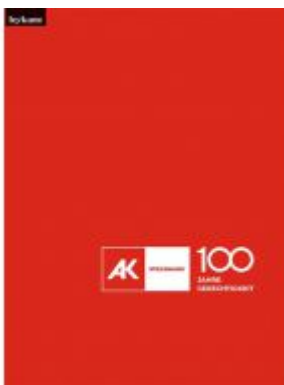
Festschrift Arbeiterkammer Steiermark – 100 Jahre Gerechtigkeit Ladenpreis: 30,00 EUR