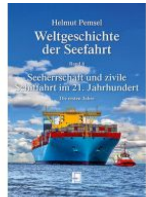
Weltgeschichte der Seefahrt / Seeherrschaft und zivile Schifffahrt im 21. Jahrhundert Ladenpreis: 38,80 EUR