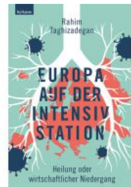
Europa auf der Intensivstation Ladenpreis: 22,50 EUR