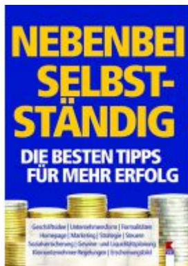
Nebenbei selbstständig. Die besten Tipps für mehr Erfolg Ladenpreis: 19,90 EUR