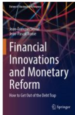
Financial Innovations and Monetary Reform Ladenpreis: 54,99EUR