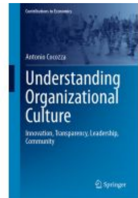
Understanding Organizational Culture Ladenpreis: 109,99EUR