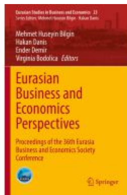
Eurasian Business and Economics Perspectives Ladenpreis: 164,99EUR