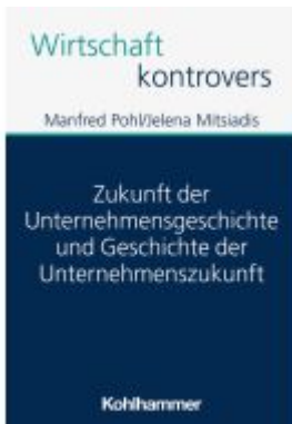
Zukunft der Unternehmensgeschichte und Geschichte der Unternehmenszukunft Ladenpreis: 25,70EUR

Wir haben andere Produkte gefunden, die Ihnen gefallen könnten!