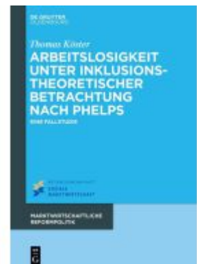
Arbeitslosigkeit unter inklusionstheoretischer Betrachtung nach Phelps Ladenpreis: 49,95EUR