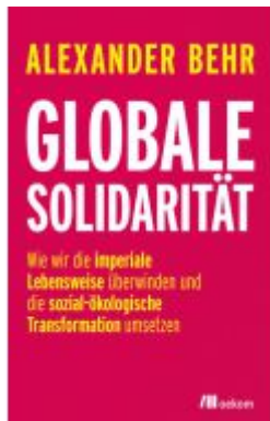
Globale Solidarität Ladenpreis: 20,60EUR