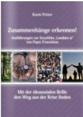
Zusammenhänge erkennen! Ladenpreis: 9,90 EUR