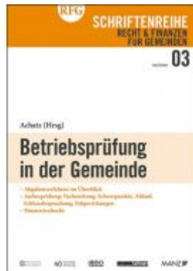
Betriebsprüfung in der Gemeinde Ladenpreis: 18,00 EUR