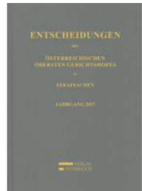
Entscheidungen des Österreichischen Obersten Gerichtshofes in Strafsachen Ladenpreis: 179,00 EUR