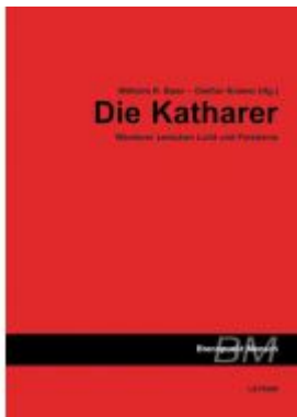
Die Katharer Ladenpreis: 14,90 EUR

Wir haben andere Produkte gefunden, die Ihnen gefallen könnten!