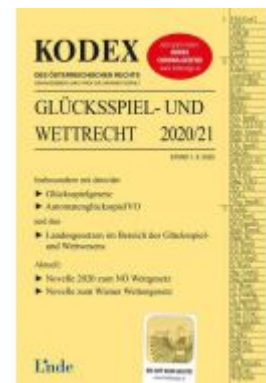
KODEX Glücksspiel- und Wettrecht 2020/21 Ladenpreis: 68,00 EUR