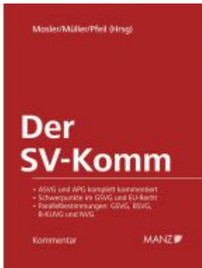
Der SV-Komm Ladenpreis: 398,00 EUR