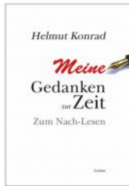
Meine Gedanken zur Zeit Ladenpreis: 18,50 EUR