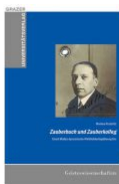
Zauberbuch und Zauberkolleg – Ernst Mallys dynamische Wirklichkeitsphilosophie Ladenpreis: 17,90 EUR