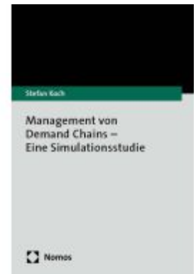
Management von Demand Chains – Eine Simulationsstudie Ladenpreis: 40,10EUR