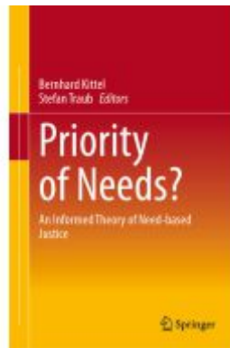
Priority of Needs? Ladenpreis: 186,99EUR