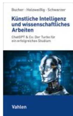
Künstliche Intelligenz und wissenschaftliches Arbeiten Ladenpreis: 17,40EUR