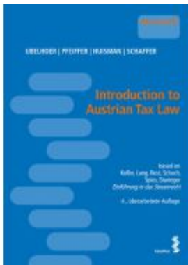
Introduction to Austrian Tax Law Ladenpreis: 28,00EUR

Wir haben andere Produkte gefunden, die Ihnen gefallen könnten!