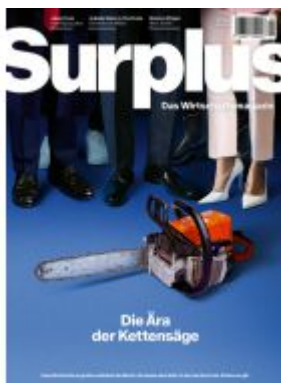
Die Ära der Kettensäge Ladenpreis: 9,00EUR