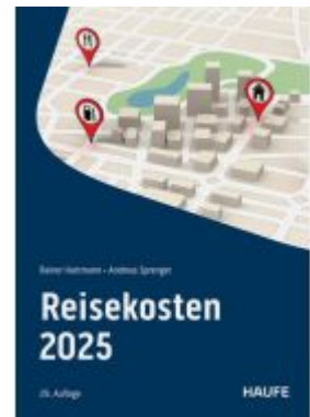
Reisekosten 2025 Ladenpreis: 61,70EUR