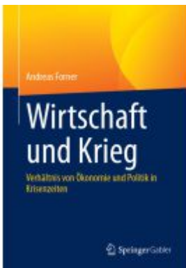
Wirtschaft und Krieg Ladenpreis: 66,81EUR