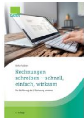
Rechnungen schreiben – schnell, einfach, wirksam Ladenpreis: 22,66EUR