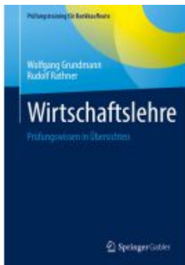
Wirtschaftslehre Ladenpreis: 25,69EUR