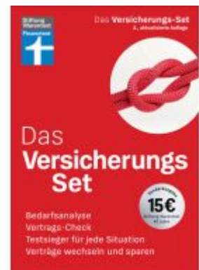
Das Versicherungs-Set Ladenpreis: 15,50EUR