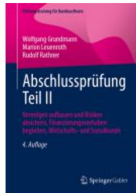
Abschlussprüfung Teil II Ladenpreis: 46,25EUR