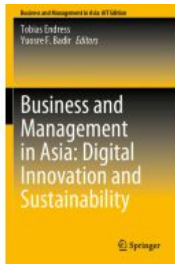
Business and Management in Asia: Digital Innovation and Sustainability Ladenpreis: 175,99EUR