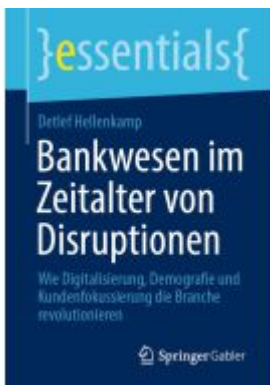
Bankwesen im Zeitalter von Disruptionen Ladenpreis: 15,41EUR