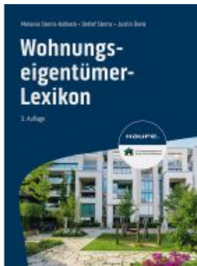
Wohnungseigentümer-Lexikon Ladenpreis: 41,20EUR

Wir haben andere Produkte gefunden, die Ihnen gefallen könnten!