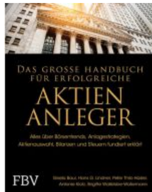
Das große Handbuch für erfolgreiche Aktien-Anleger Ladenpreis: 36,00EUR