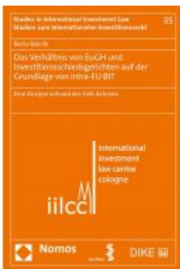
Das Verhältnis von EuGH und Investitionsschiedsgerichten auf der Grundlage von intra-EU BIT Ladenpreis: 100,80 EUR