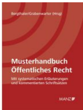
Musterhandbuch Öffentliches Recht Ladenpreis: 248,00 EUR