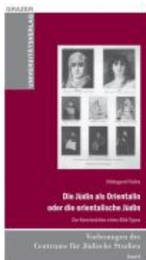
Die Jüdin als Orientalin oder die orientalische Jüdin Ladenpreis: 9,90 EUR