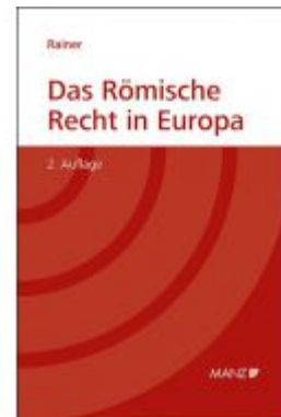
Das Römische Recht in Europa Ladenpreis: 68,00 EUR