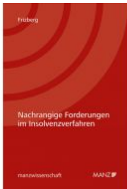
Nachrangige Forderungen im Insolvenzverfahren Ladenpreis: 62,00 EUR