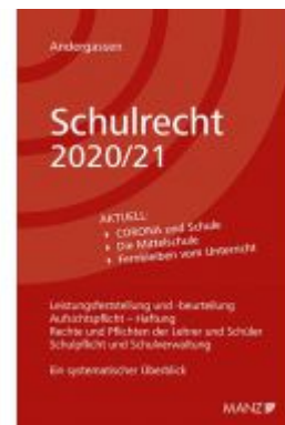
Schulrecht 2020/21 Ladenpreis: 38,00 EUR