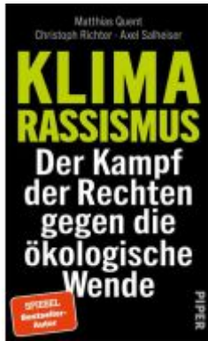
Klimarassismus Ladenpreis: 20,60EUR