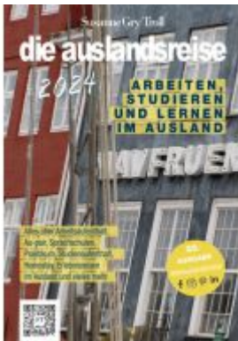
die auslandsreise 2024 Ladenpreis: 18,50EUR