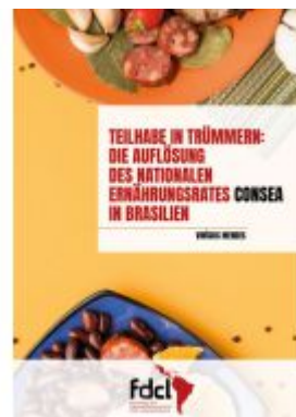
TEILHABE IN TRÜMMERN Ladenpreis: 3,10EUR