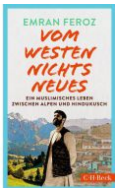
Vom Westen nichts Neues Ladenpreis: 18,50EUR