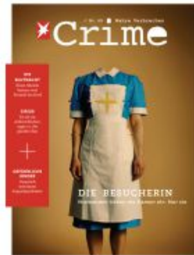
stern Crime - Wahre Verbrechen Ladenpreis: 7,30EUR