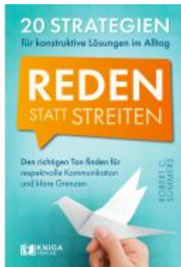
Reden statt streiten. Ladenpreis: 19,99EUR