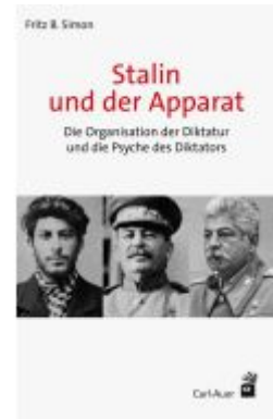
Stalin und der Apparat Ladenpreis: 36,00EUR