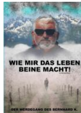
Wie mir das Leben Beine macht! Ladenpreis: 24,70EUR