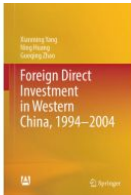
Foreign Direct Investment in Western China, 1994–2004 Ladenpreis: 142,99EUR

Wir haben andere Produkte gefunden, die Ihnen gefallen könnten!