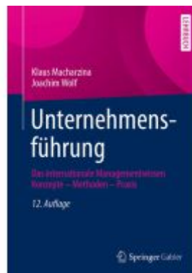
Unternehmensführung Ladenpreis: 87,37EUR