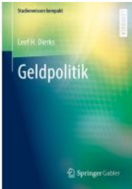
Geldpolitik Ladenpreis: 25,69EUR