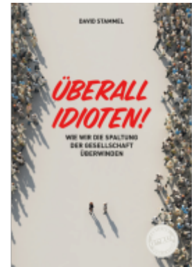
Überall Idioten! Ladenpreis: 20,50EUR