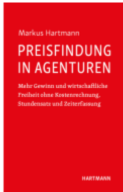
Preisfindung in Agenturen Ladenpreis: 34,90EUR