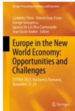
Europe in the New World Economy: Opportunities and Challenges Ladenpreis: 241,99EUR