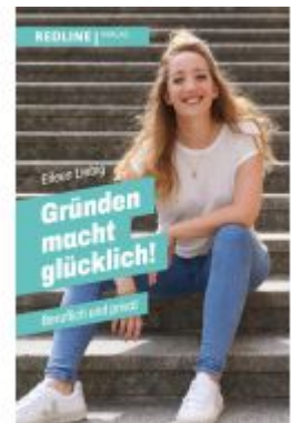
Gründen macht glücklich! Ladenpreis: 22,70EUR