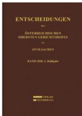
Entscheidungen des Obersten Gerichtshofes in Zivilsachen Ladenpreis: 208,00EUR