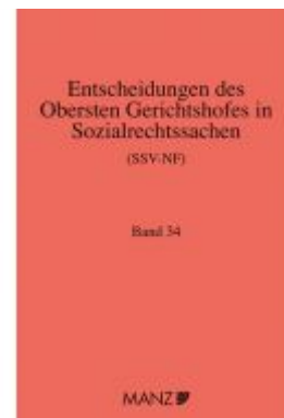
Entscheidungen des obersten Gerichtshofes in Sozialrechtssachen SSV- NF Ladenpreis: 159,80EUR