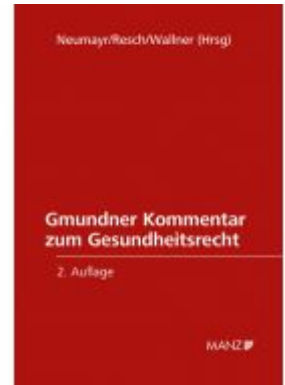
Grundriss Kommentar zum Gesundheitsrecht Ladenpreis: 528,00EUR