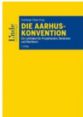
Die Aarhus-Konvention Ladenpreis: 46,00EUR