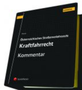
Österreichisches Straßenverkehrsrecht - Kraftfahrrecht Ladenpreis: 487,00EUR