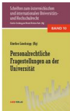
Personalrechtliche Fragestellungen an der Universität Ladenpreis: 36,00EUR