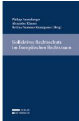
Kollektiver Rechtsschutz im Europäischen Rechtsraum Ladenpreis: 69,00EUR