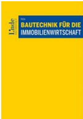
Bautechnik für die Immobilienwirtschaft Ladenpreis: 96,00EUR