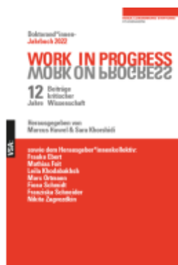
WORK IN PROGRESS. WORK ON PROGRESS Ladenpreis: 20,40EUR