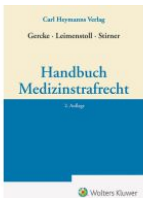
Handbuch Medizinstrafrecht Ladenpreis: 132,70EUR