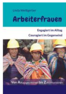
Arbeiterfrauen Ladenpreis: 18,00EUR