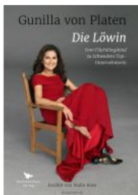
Die Löwin Ladenpreis: 28,80EUR