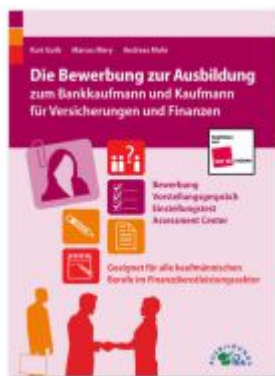
Die Bewerbung zur Ausbildung zum Bankkaufmann und Kaufmann für Versicherungen und Finanzen Ladenpreis: 30,80EUR