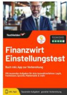
Finanzwirt Einstellungstest: Buch inkl. App zur Vorbereitung - Mit tausenden Aufgaben für dein Auswahlverfahren: Logik, Fachwissen, Sprache, Mathematik & mehr Ladenpreis: 41,10EUR