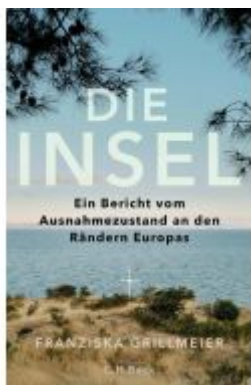
Die Insel Ladenpreis: 24,70EUR