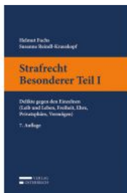
Strafrecht Besonderer Teil I Ladenpreis: 35,00 EUR