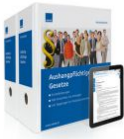
Aushangpflichtige Gesetze Ladenpreis: 118,80 EUR