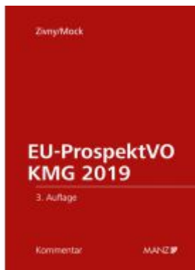
EU-ProspektVO/KMG 2019 Ladenpreis: 148,00 EUR

Wir haben andere Produkte gefunden, die Ihnen gefallen könnten!