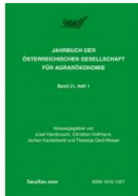
Diversifizierung versus Spezialisierung in der Agrar- und Ernährungswirtschaft Ladenpreis: 17,90 EUR