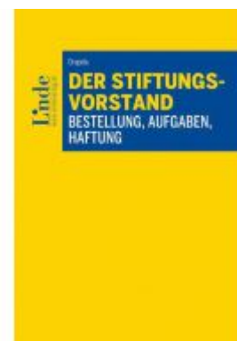
Der Stiftungsvorstand - Bestellung, Aufgaben, Haftung Ladenpreis: 54,00 EUR