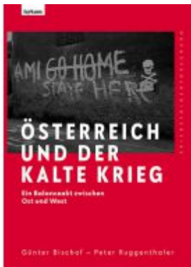
Österreich und der Kalte Krieg Ladenpreis: 39,00 EUR