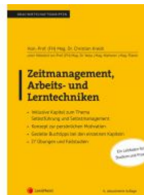
Zeitmanagement, Arbeits- und Lerntechniken Ladenpreis: 28,00 EUR