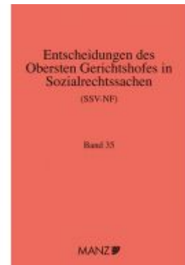
Entscheidungen des obersten Gerichtshofes in Sozialrechtssachen SSV- NF Ladenpreis: 164,80 EUR