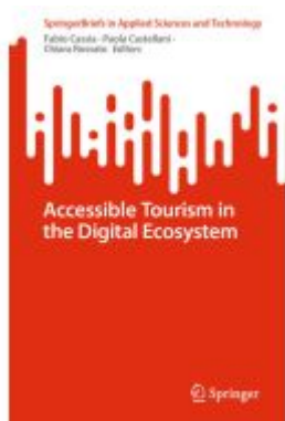
Accessible Tourism in the Digital Ecosystem Ladenpreis: 49,49EUR