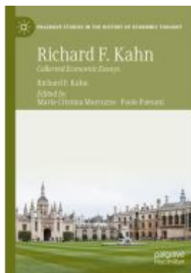
Richard F. Kahn Ladenpreis: 109,99EUR