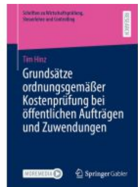
Grundsätze ordnungsgemäßer Kostenprüfung bei öffentlichen Aufträgen und Zuwendungen Ladenpreis: 77,09EUR