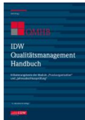
IDW Qualitätsmanagement Handbuch (QMHB) Ladenpreis: 56,60EUR