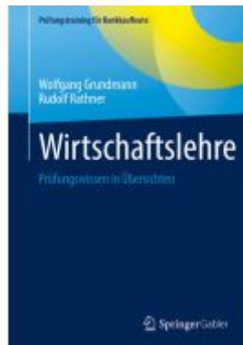
Wirtschaftslehre Ladenpreis: 25,69EUR