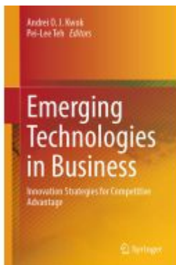
Emerging Technologies in Business Ladenpreis: 197,99EUR