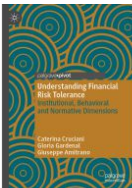
Understanding Financial Risk Tolerance Ladenpreis: 49,49EUR