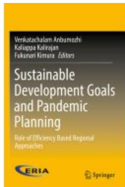
Sustainable Development Goals and Pandemic Planning Ladenpreis: 307,99EUR

Wir haben andere Produkte gefunden, die Ihnen gefallen könnten!