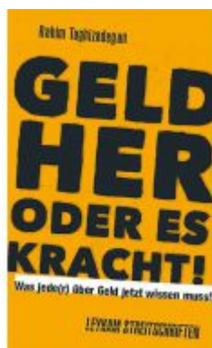
Geld her oder es kracht! Was jede(r) über Geld jetzt wissen muss! Ladenpreis: 12,00 EUR