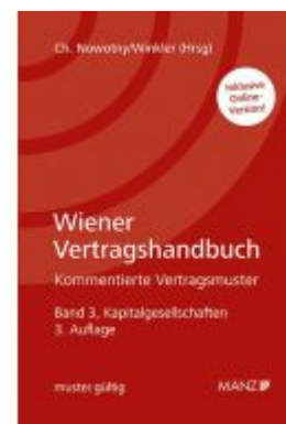
Wiener Vertragshandbuch Kapitalgesellschaften Ladenpreis: 258,00 EUR