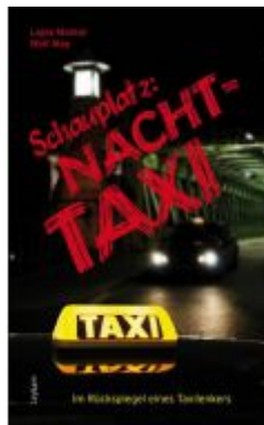
Schauplatz: Nachttaxi Ladenpreis: 17,90 EUR