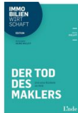
Der Tod des Maklers Ladenpreis: 29,00 EUR