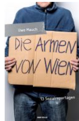
Die Armen von Wien Ladenpreis: 19,90 EUR