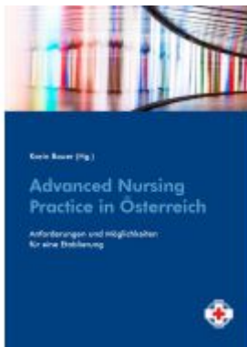
Advanced Nursing Practice in Österreich Ladenpreis: 14,90 EUR

Wir haben andere Produkte gefunden, die Ihnen gefallen könnten!