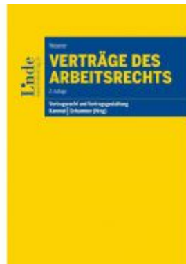
Verträge des Arbeitsrechts Ladenpreis: 42,00 EUR