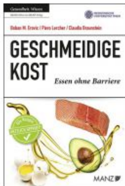
Geschmeidige Kost Ladenpreis: 23,90 EUR