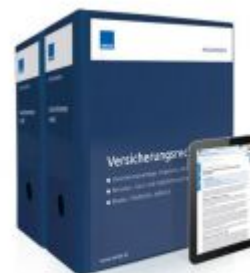
Versicherungsrecht Ladenpreis: 249,90 EUR