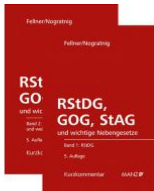
RStDG, GOG und StAG Richter- und StaatsanwaltschaftsdienstG, GerichtsorganisationsG und StaatsanwaltschaftsG Ladenpreis: 298,00 EUR