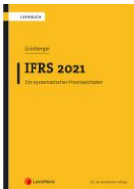
IFRS 2021 Ladenpreis: 42,00 EUR