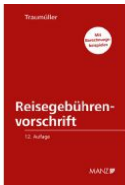
Reisegebührenvorschrift der Bundesbediensteten Ladenpreis: 68,00 EUR