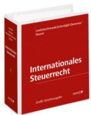
Internationales Steuerrecht Ladenpreis: 498,00 EUR