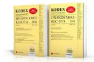
KODEX Finanzmarktrecht Band Ia + Ib 2021 - inkl. App Ladenpreis: 95,00 EUR