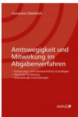
Amtswegigkeit und Mitwirkung im Abgabenverfahren Ladenpreis: 168,00 EUR