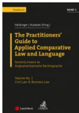
Angloamerikanische Rechtssprache / The Practitioners' Guide to Applied Comparative Law and Language Vol 1 Ladenpreis: 94,00 EUR