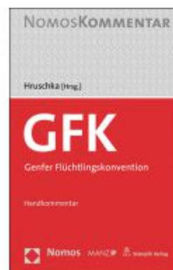
Genfer Flüchtlingskonvention Ladenpreis: 128,00EUR