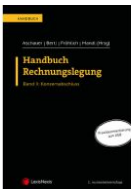
Handbuch Rechnungslegung / Handbuch Rechnungslegung, Band II: Konzernabschluss Ladenpreis: 99,00EUR