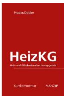
HeizKG Heiz- und Kältekostenabrechnungsgesetz Ladenpreis: 54,00EUR