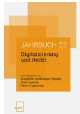
Digitalisierung und Recht Ladenpreis: 84,00EUR