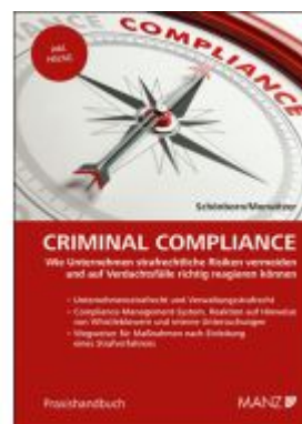
Criminal Compliance Ladenpreis: 128,00EUR