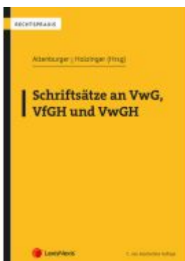
Schriftsätze an VwG, VfGH und VwGH Ladenpreis: 47,00EUR