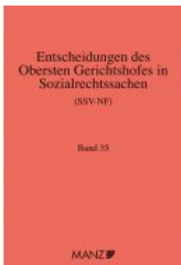
Entscheidungen des obersten Gerichtshofes in Sozialrechtssachen SSV-NF Ladenpreis: 315,90EUR