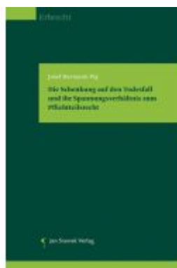
Die Schenkung auf den Todesfall und ihr Spannungsverhältnis zum Pflichtteilsrecht Ladenpreis: 98,00EUR