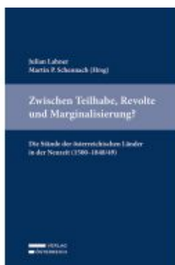
Zwischen Teilhabe, Revolte und Marginalisierung? Die Stände der österreichischen Länder in der Neuzeit (1500–1848/49) Ladenpreis: 59,00EUR