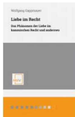
Liebe im Recht Ladenpreis: 48,00EUR