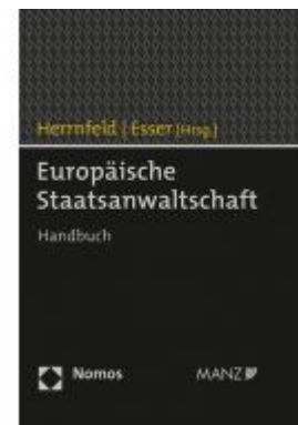
Europäische Staatsanwaltschaft Ladenpreis: 98,00EUR