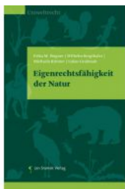
Eigenrechtsfähigkeit der Natur Ladenpreis: 55,00EUR