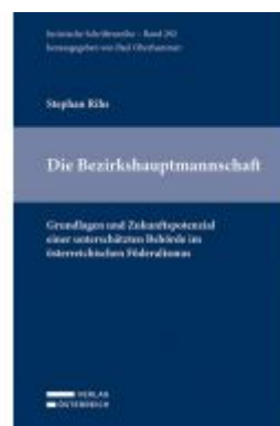
Die Bezirkshauptmannschaft Ladenpreis: 59,00EUR