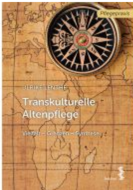
Transkulturelle Altenpflege Ladenpreis: 9,90EUR