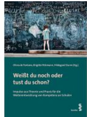
Weißt du noch oder tust du schon? Ladenpreis: 20,50EUR