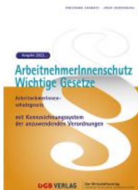
ArbeitnehmerInnenenschutz. Ladenpreis: 72,80EUR