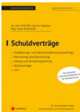
Schuldverträge (Skriptum) Ladenpreis: 30,00EUR