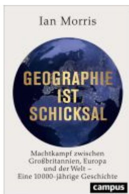
Geographie ist Schicksal Ladenpreis: 32,90EUR