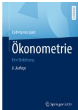
Ökonometrie Ladenpreis: 41,11EUR