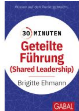
30 Minuten Geteilte Führung Ladenpreis: 11,30EUR