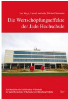
Die Wertschöpfungseffekte der Jade Hochschule Ladenpreis: 34,90EUR