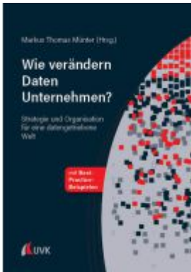
Wie verändern Daten Unternehmen? Ladenpreis: 30,80EUR