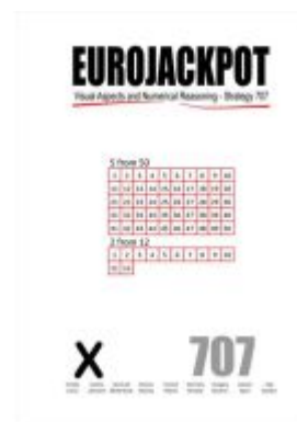
Eurojackpot Ladenpreis: 39,90EUR