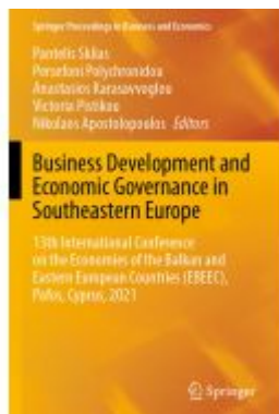
Business Development and Economic Governance in Southeastern Europe Ladenpreis: 219,99EUR

Wir haben andere Produkte gefunden, die Ihnen gefallen könnten!