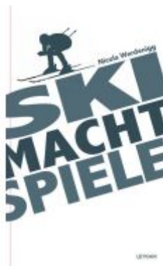
SKI MACHT SPIELE Ladenpreis: 12,90 EUR