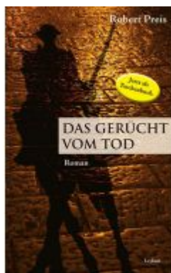
Das Gerücht vom Tod Ladenpreis: 12,90 EUR