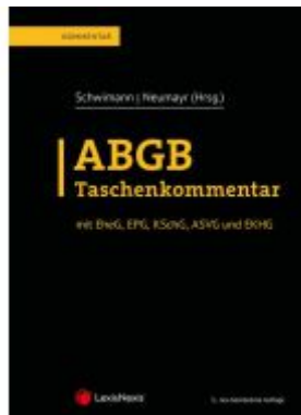
ABGB Taschenkommentar Aktionspreis: 249,00 EUR Ladenpreis: 319,00 EUR