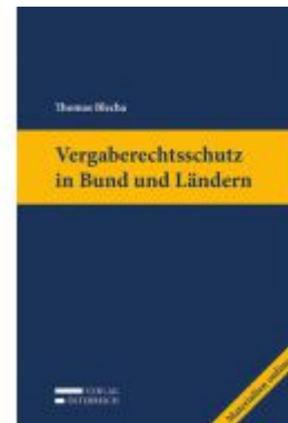
Vergaberechtsschutz in Bund und Ländern Ladenpreis: 199,00 EUR