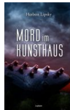
Mord im Kunsthaus Ladenpreis: 14,90 EUR