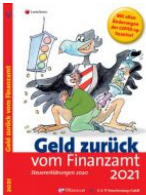
Geld zurück vom Finanzamt 2021 Ladenpreis: 19,90 EUR

Wir haben andere Produkte gefunden, die Ihnen gefallen könnten!