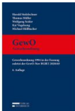
GewO Gewerbeordnung Ladenpreis: 489,00 EUR