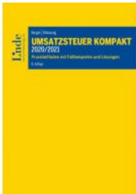
Umsatzsteuer kompakt 2020/2021 Ladenpreis: 59,00 EUR