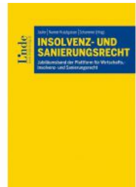
Insolvenz- und Sanierungsrecht Ladenpreis: 69,00 EUR