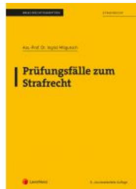
Strafrecht - Prüfungsfälle zum Strafrecht (Skriptum) Ladenpreis: 15,00 EUR