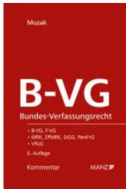
Bundes-Verfassungsrecht B-VG Ladenpreis: 194,00 EUR