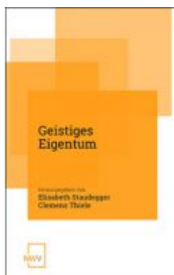
Geistiges Eigentum Ladenpreis: 68,00 EUR