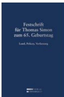
Festschrift für Thomas Simon zum 65. Geburtstag Ladenpreis: 109,00 EUR