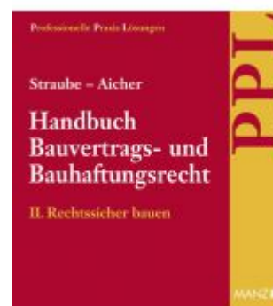
Handbuch Bauvertrags- und Bauhaftungsrecht Band II: Rechtssicher Bauen Ladenpreis: 148,00 EUR