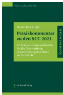
Praxiskommentar zu den SCC 2021 Ladenpreis: 128,00 EUR

Wir haben andere Produkte gefunden, die Ihnen gefallen könnten!