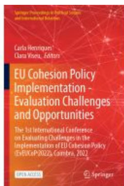
EU Cohesion Policy Implementation - Evaluation Challenges and Opportunities Ladenpreis: 43,99EUR