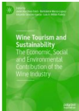
Wine Tourism and Sustainability Ladenpreis: 164,99EUR