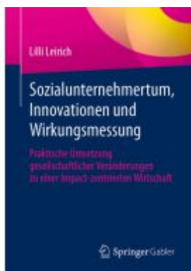
Sozialunternehmertum, Innovationen und Wirkungsmessung Ladenpreis: 39,06EUR