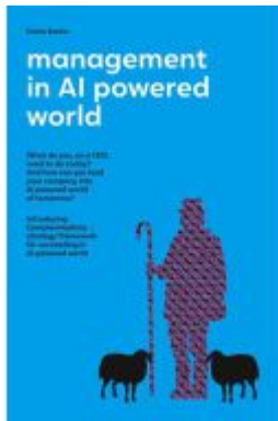
Management in AI powered world Ladenpreis: 12,99EUR