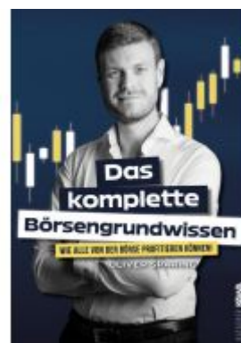
Das komplette Börsengrundwissen Ladenpreis: 20,50EUR