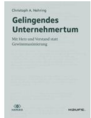
Gelingendes Unternehmertum Ladenpreis: 30,90EUR