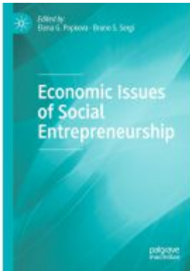
Economic Issues of Social Entrepreneurship Ladenpreis: 175,99EUR