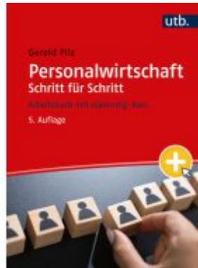
Personalwirtschaft Schritt für Schritt Ladenpreis: 33,90EUR