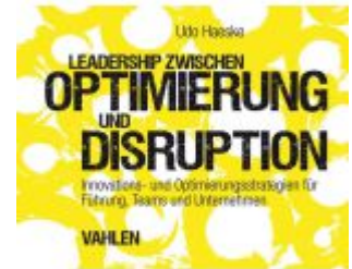
Leadership zwischen Optimierung und Disruption Ladenpreis: 25,60EUR