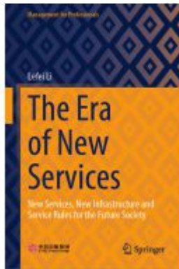
The Era of New Services Ladenpreis: 153,99EUR