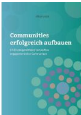
Communities erfolgreich aufbauen Ladenpreis: 9,99EUR

Wir haben andere Produkte gefunden, die Ihnen gefallen könnten!