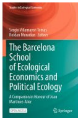
The Barcelona School of Ecological Economics and Political Ecology Ladenpreis: 43,99EUR