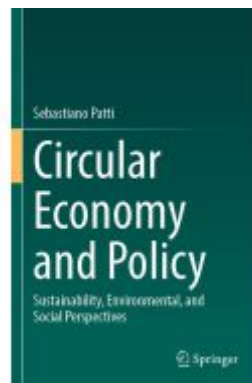
Circular Economy and Policy Ladenpreis: 109,99EUR