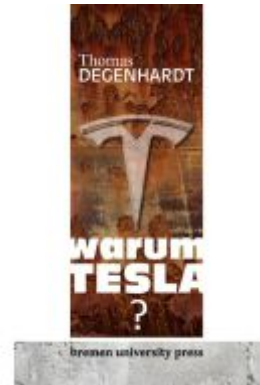
Warum Tesla? Ladenpreis: 18,40EUR