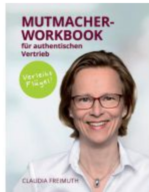
Mutmacher Workbook Ladenpreis: 24,90EUR