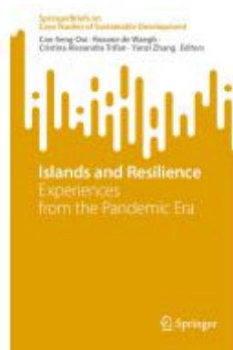
Islands and Resilience Ladenpreis: 49,49EUR