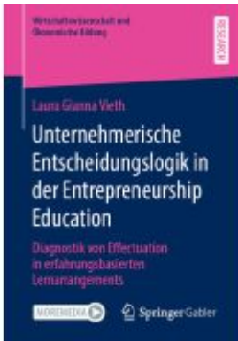
Unternehmerische Entscheidungslogik in der Entrepreneurship Education Ladenpreis: 82,24EUR