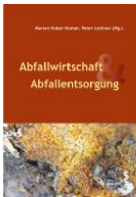
Abfallwirtschaft & Abfallentsorgung Ladenpreis: 32,00EUR