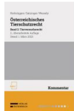
Österreichisches Tierschutzrecht Ladenpreis: 88,00EUR