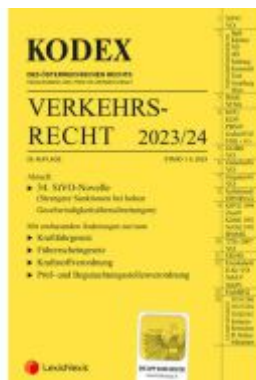
KODEX Verkehrsrecht 2023/24 - inkl. App Ladenpreis: 95,00EUR