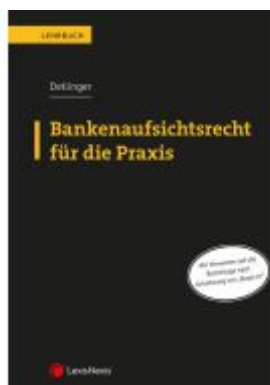
Bankenaufsichtsrecht für die Praxis Ladenpreis: 59,00EUR