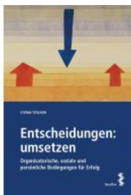
Entscheidungen: umsetzen Ladenpreis: 38,00EUR