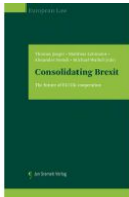
Consolidating Brexit Ladenpreis: 85,00EUR