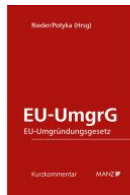
EU-Umgründungsgesetz Ladenpreis: 118,00EUR