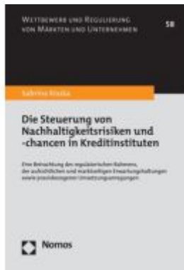
Die Steuerung von Nachhaltigkeitsrisiken und -chancen in Kreditinstituten Ladenpreis: 132,70EUR