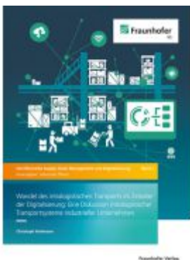
Wandel des intralogistischen Transports im Zeitalter der Digitalisierung Ladenpreis: 72,00EUR