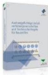
Aushangpflichtige Unfallverhütungsvorschriften und Technische Regeln für Baustellen Ladenpreis: 55,60EUR