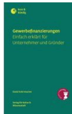
Gewerbefinanzierungen Ladenpreis: 18,50EUR