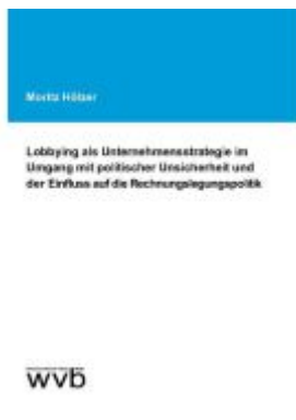
Lobbying als Unternehmensstrategie im Umgang mit politischer Unsicherheit und der Einfluss auf die Rechnungslegungspolitik Ladenpreis: 39,10EUR