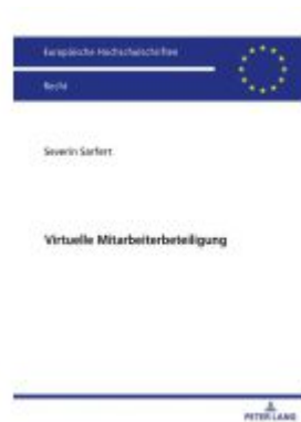
Virtuelle Mitarbeiterbeteiligung Ladenpreis: 46,20EUR