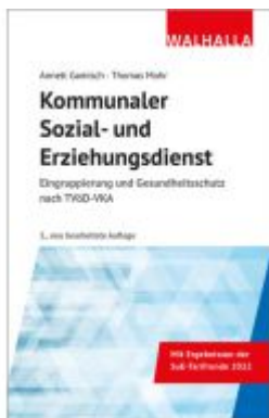
Kommunaler Sozial- und Erziehungsdienst Ladenpreis: 30,80EUR