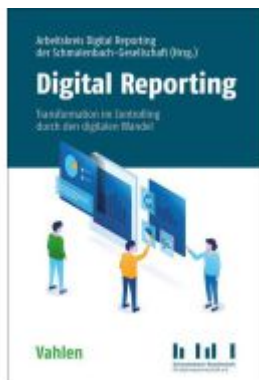
Digital Reporting Ladenpreis: 41,00EUR

Wir haben andere Produkte gefunden, die Ihnen gefallen könnten!