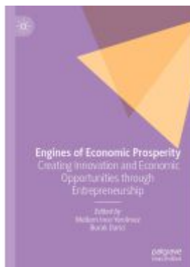
Engines of Economic Prosperity Ladenpreis: 186,99EUR