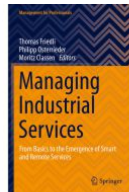
Managing Industrial Services Ladenpreis: 71,49EUR