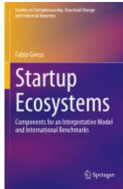
Startup Ecosystems Ladenpreis: 131,99EUR