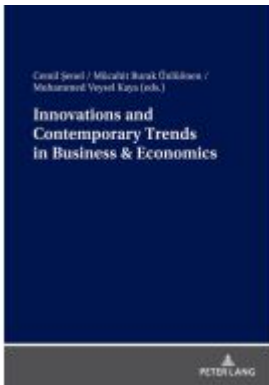
Innovations and Contemporary Trends in Business & Economics Ladenpreis: 46,20EUR