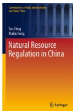
Natural Resource Regulation in China Ladenpreis: 142,99EUR