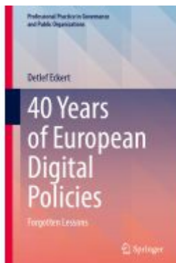
40 Years of European Digital Policies Ladenpreis: 93,49EUR