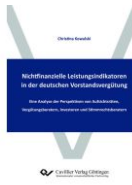
Nichtfinanzielle Leistungsindikatoren in der deutschen Vorstandsvergütung Ladenpreis: 105,90EUR