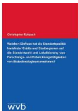
Welchen Einfluss hat die Standortqualität kreisfreier Städte und Stadtregionen auf die Standortwahl und Lokalisierung von Forschungs- und Entwicklungstätigkeiten von Biotechnologieunternehmen? Ladenpreis: 25,70EUR