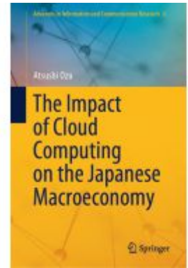
The Impact of Cloud Computing on the Japanese Macroeconomy Ladenpreis: 142,99EUR