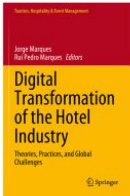
Digital Transformation of the Hotel Industry Ladenpreis: 186,99EUR