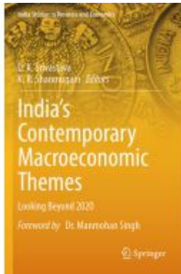
India's Contemporary Macroeconomic Themes Ladenpreis: 175,99EUR