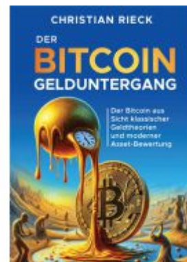
Der Bitcoin-Gelduntergang Ladenpreis: 18,00EUR