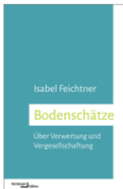
Bodenschätze Ladenpreis: 15,40EUR

Wir haben andere Produkte gefunden, die Ihnen gefallen könnten!