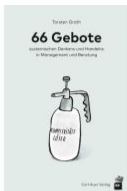
66 Gebote systemischen Denkens und Handelns in Management und Beratung Ladenpreis: 35,00EUR