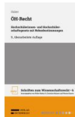
ÖH-Recht Ladenpreis: 68,00EUR