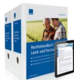
Rechtshandbuch Land- und Forstwirtschaft Ladenpreis: 239,80EUR