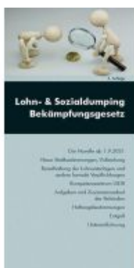
Lohn- und Sozialdumping Bekämpfungsgesetz Ladenpreis: 12,60EUR