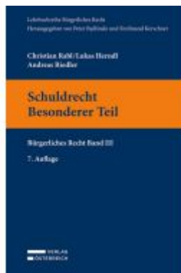
Schuldrecht. Besonderer Teil Ladenpreis: 34,00EUR