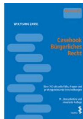
Casebook Bürgerliches Recht Ladenpreis: 48,00EUR