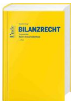
Bilanzrecht Ladenpreis: 118,00EUR