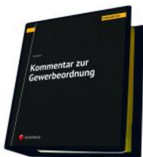
Kommentar zur Gewerbeordnung Ladenpreis: 455,00EUR