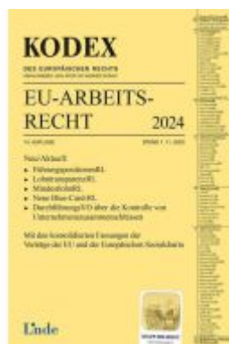
KODEX EU-Arbeitsrecht 2024 Ladenpreis: 72,00EUR