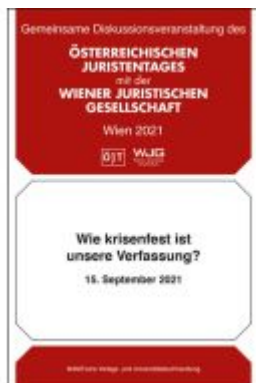
Wie krisenfest ist unsere Verfassung? Diskussionsveranstaltung vom 15. September 2021 Ladenpreis: 19,00EUR