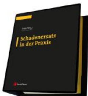
Schadenersatz in der Praxis Ladenpreis: 374,00EUR

Wir haben andere Produkte gefunden, die Ihnen gefallen könnten!