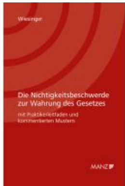
Die Nichtigkeitsbeschwerde zur Wahrung des Gesetzes Ladenpreis: 48,00EUR