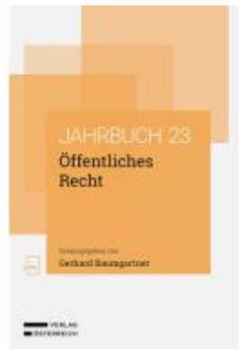
Öffentliches Recht Ladenpreis: 89,00EUR