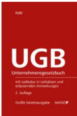
UGB Ladenpreis: 248,00EUR