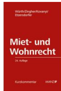
Miet- und Wohnrecht Ladenpreis: 108,00EUR