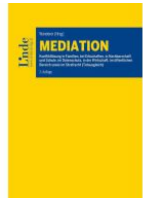
Mediation Ladenpreis: 68,00EUR