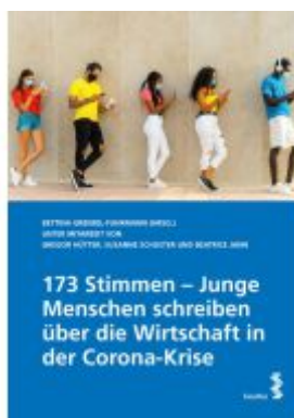
173 Stimmen - Junge Menschen schreiben über die Wirtschaft in der Corona-Krise Ladenpreis: 12,00EUR