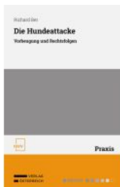
Die Hundeattacke Ladenpreis: 48,00EUR