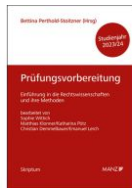
Prüfungsvorbereitung Einführung in die Rechtswissenschaften und ihre Methoden Ladenpreis: 20,90EUR