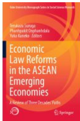
Economic Law Reforms in the ASEAN Emerging Economies Ladenpreis: 175,99EUR