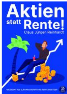
Aktien statt Rente! Wie Sie mit 100 Euro pro Monat Ihre Rente ersetzen Ladenpreis: 36,00EUR