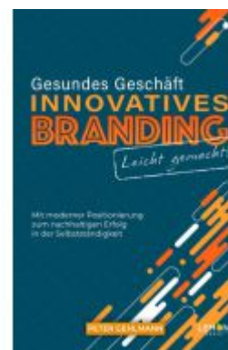
Gesundes Geschäft - innovatives Branding leicht gemacht Ladenpreis: 13,30EUR