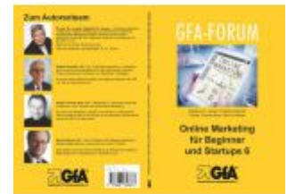
Online Marketing für Beginner und Startups / Online Marketing für Beginner und Startups 6 Ladenpreis: 15,30EUR