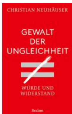
Gewalt der Ungleichheit. Würde und Widerstand Ladenpreis: 22,70EUR