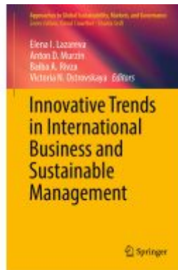
Innovative Trends in International Business and Sustainable Management Ladenpreis: 164,99EUR