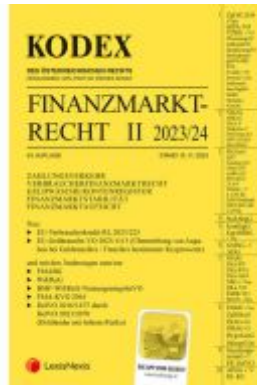
KODEX Finanzmarktrecht Band II 2023/24 - inkl. App Ladenpreis: 86,00EUR