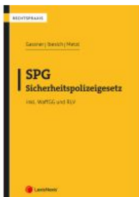
SPG - Sicherheitspolizeigesetz Ladenpreis: 39,00EUR