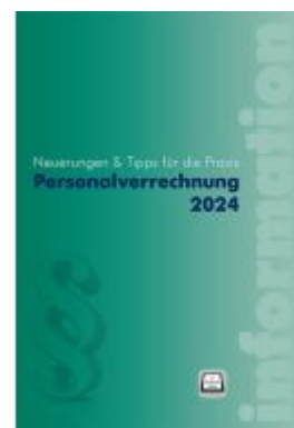
Personalverrechnung 2024 Ladenpreis: 46,00EUR