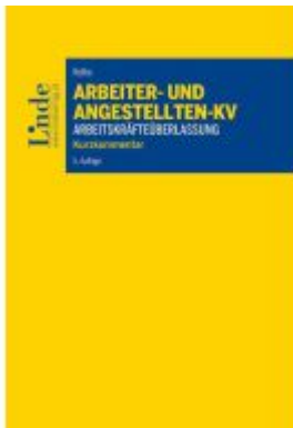
Arbeiter- und Angestelltenkollektivvertrag für das Gewerbe der Arbeitskräfteüberlassung Ladenpreis: 79,00EUR