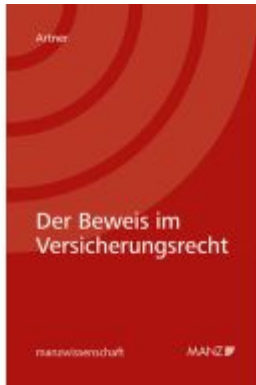
Der Beweis im Versicherungsrecht Ladenpreis: 54,00EUR