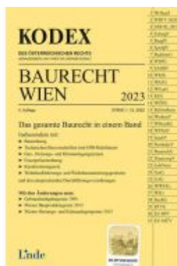
KODEX Baurecht Wien 2023 Ladenpreis: 55,00EUR