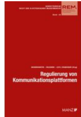
Regulierung von Kommunikationsplattformen Aktuelle Fragen der Umsetzung Ladenpreis: 48,00EUR