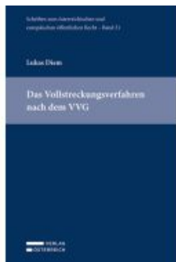
Das Vollstreckungsverfahren nach dem VVG Ladenpreis: 69,00EUR