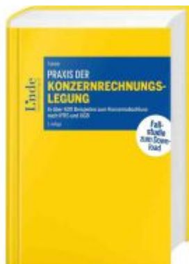
Praxis der Konzernrechnungslegung Ladenpreis: 178,00EUR