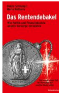
Das Rentendebakel Ladenpreis: 29,90EUR