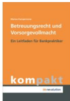
Betreuungsrecht und Vorsorgevollmacht Ladenpreis: 8,30EUR