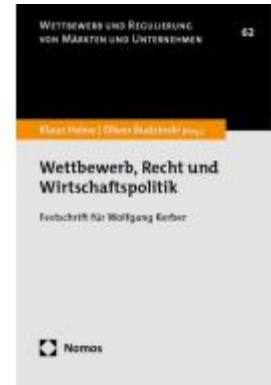
Wettbewerb, Recht und Wirtschaftspolitik Ladenpreis: 86,40EUR