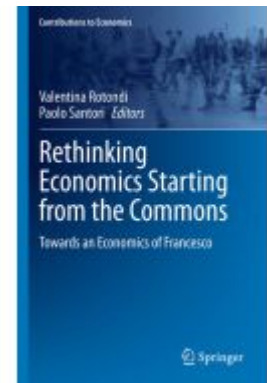
Rethinking Economics Starting from the Commons Ladenpreis: 153,99EUR