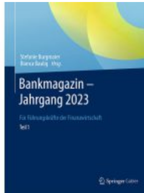
Bankmagazin - Jahrgang 2023 – Teil 1 Ladenpreis: 51,39EUR