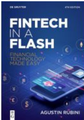
Fintech in a Flash Ladenpreis: 24,95EUR