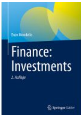
Finance: Investments Ladenpreis: 51,39EUR

Wir haben andere Produkte gefunden, die Ihnen gefallen könnten!