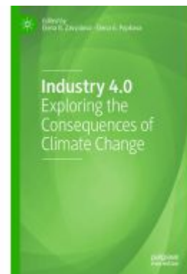
Industry 4.0 Ladenpreis: 186,99EUR