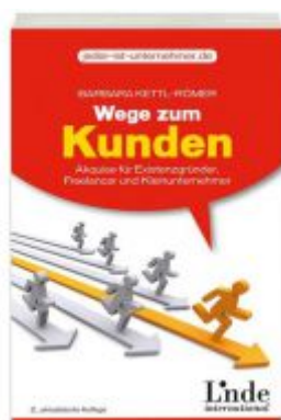
Wege zum Kunden Ladenpreis: 19,90 EUR