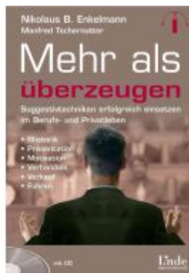
Mehr als überzeugen Ladenpreis: 25,60 EUR