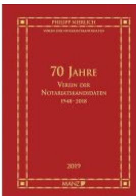
70 Jahre Verein der Notariatskandidaten 1948-2018 Ladenpreis: 30,80 EUR