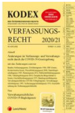
KODEX Verfassungsrecht 2020/21 Ladenpreis: 40,00 EUR