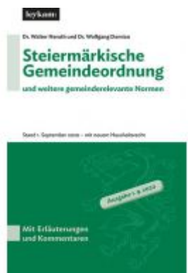
Steiermärkische Gemeindeordnung und weitere gemeinderelevante Normen Ladenpreis: 75,00 EUR