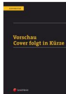
PAKET Exekutionsordnung Kommentar Ladenpreis: 499,00 EUR