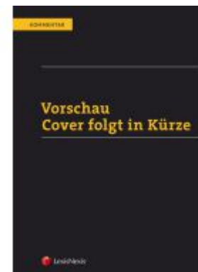
ABGB Praxiskommentar / ABGB Praxiskommentar - Band 6, 5. Auflage Aktionspreis: 158,40 EUR Ladenpreis: 198,00 EUR