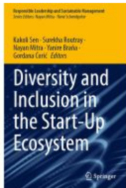
Diversity and Inclusion in the Start-Up Ecosystem Ladenpreis: 175,99EUR