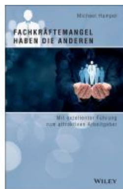
Fachkräftemangel haben die anderen Ladenpreis: 27,80EUR