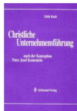
Christliche Unternehmensführung Ladenpreis: 23,70EUR