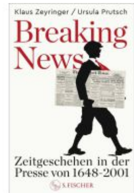
Breaking News Ladenpreis: 29,90EUR