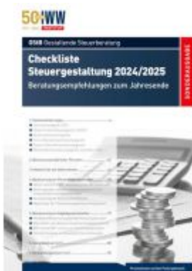
Checkliste Steuergestaltung 2024/2025 Ladenpreis: 41,10EUR