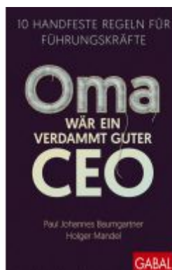
Oma wär ein verdammt guter CEO Ladenpreis: 22,70EUR