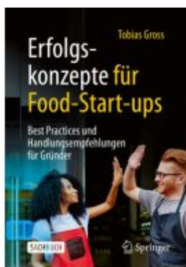
Erfolgskonzepte für Food-Start-ups Ladenpreis: 25,69EUR