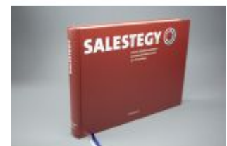
SALESTEGY (deutsche Ausgabe) Ladenpreis: 77,10EUR