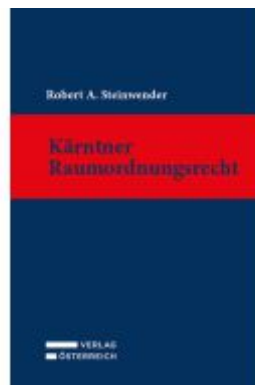
Kärntner Raumordnungsrecht Ladenpreis: 166,00EUR