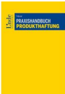
Praxishandbuch Produkthaftung Ladenpreis: 39,00EUR

Wir haben andere Produkte gefunden, die Ihnen gefallen könnten!