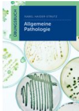
Übungsbuch Allgemeine Pathologie Ladenpreis: 16,90EUR