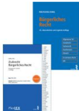
Kombipaket Bürgerliches Recht und FlexLex Zivilrecht/Bürgerliches Recht | Studium Ladenpreis: 68,00EUR