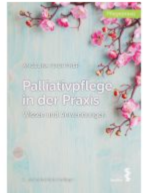
Palliativpflege in der Praxis Ladenpreis: 26,90EUR