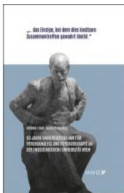
50 Jahre Universitätsklinik für Psychoanalyse und Psychotherapie an der (Medizinischen) Universität Wien Ladenpreis: 38,00EUR