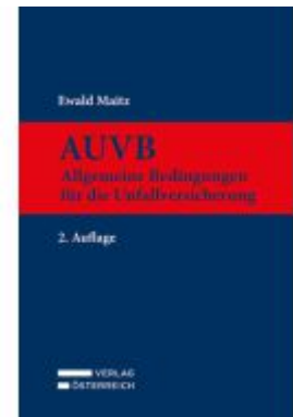
AUVB Ladenpreis: 169,00EUR